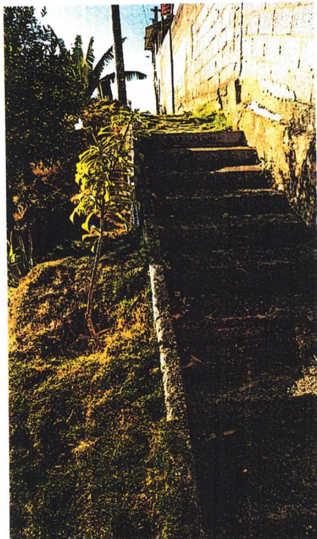
Escadaria por debaixo da qual passa a tubulação da rede de esgoto.